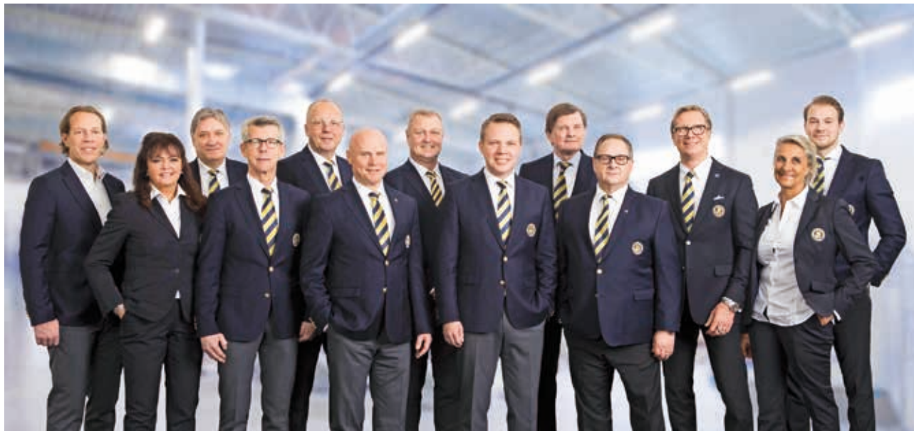
Svenska Ishockeyförbundets styrelse